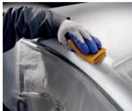
Opacizzazione di colori e vernici delicate